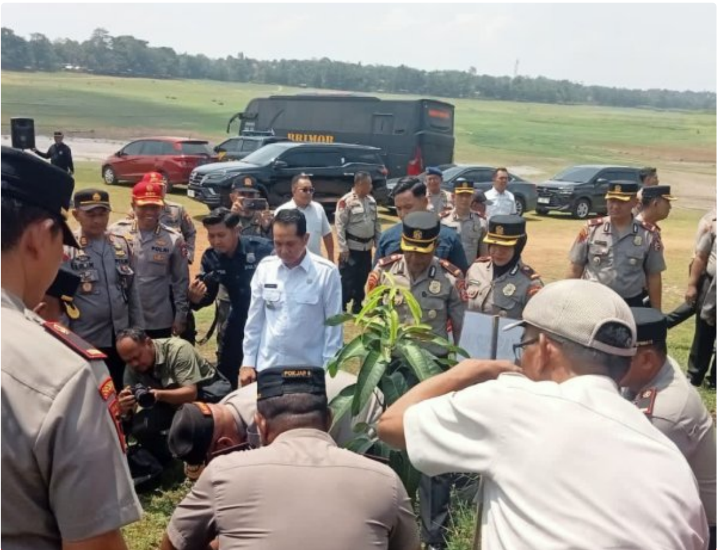
Bakso Serdik Sespimma Sespim Lemdiklat Polri angkatan ke 72 di Waduk Gembong, Pati, (06/11/2024)

Pati - Dalam rangka mendukung Program Asta Cita Pemerintah, Peserta Didik (Serdik) Sespimma Sespim Lemdiklat Polri angkatan ke 72 T. A. 2024 melaksanakan Bakti sosial (Baksos) berupa Penanaman Pohon, Penebaran Benih Ikan serta Pelepasan Burung serta penyaluran Paket Sembako kepada