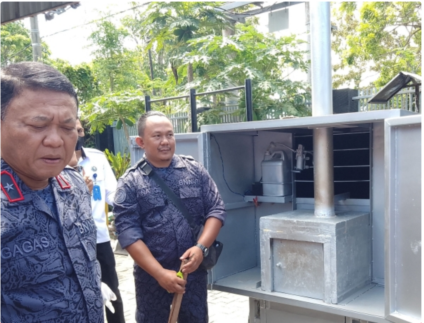
Kepala BNNP NTB saat pemusnahan BB sabu dengan mesin insenerator. (10/11)

Mataram NTB - Menindak lanjuti peraturan perundang-undangan terkait pemusnahan barang bukti narkoba yang disita dari hasil penindakan atas Peredaran gelap Narkoba, Badan Narkotika Nasional Provinsi Nusa Tenggara Barat (BNNP NTB) melakukan pemusnahan Barang Bukti hasil pengungkapan