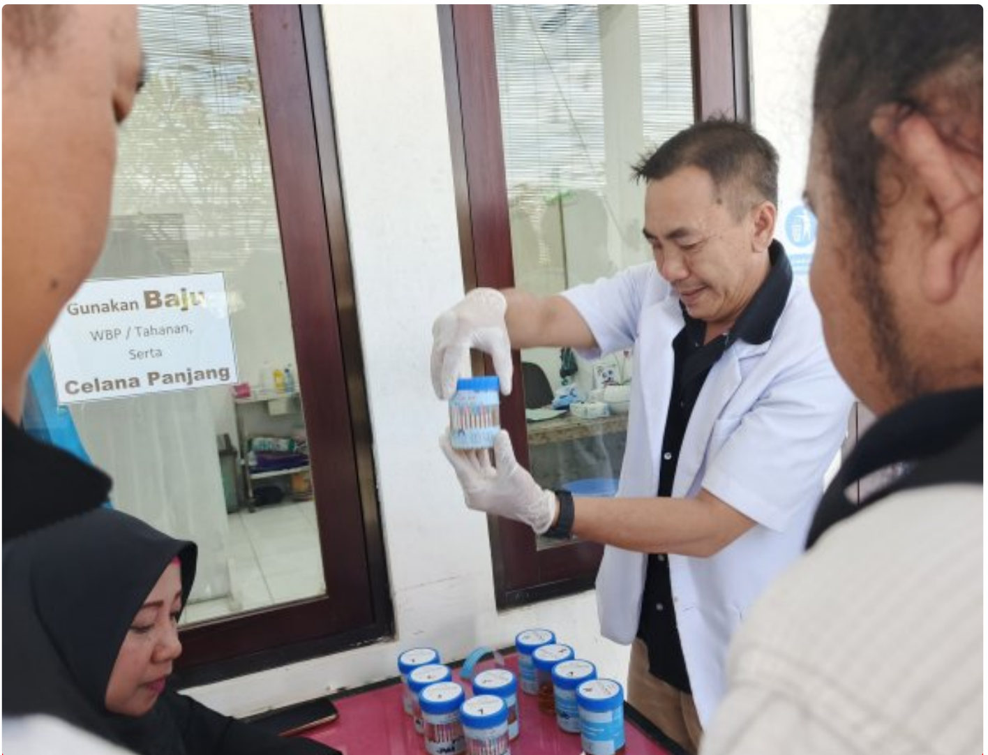
Proses tes urine bagi WBP, serta petugas Lapas Lobar Rabu (06/11/2024)

Lombok Barat NTB - Lembaga Pemasarakatan Kelas II A Lombok Barat (Lapas Lobar) Kanwil Kemenkumham NTB terus berkomitmen mencegah sekaligus mengantisipasi penyalahgunaan dan peredaran gelap Narkotika dengan melaksanakan Tes urine berkala bagi Warga Binaan Pemasarakatan (WBP) dan Para tahanan Narkoba serta petugas Lapas Lobar, Rabu (06/11/2024).